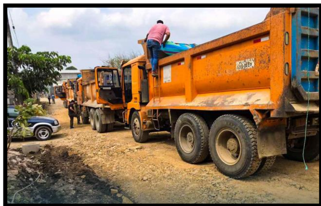
Tabla n°4. Detalle de maquinarias aportadas por los Cantones